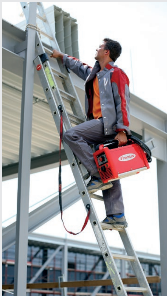
/ Léger et mobile, donc à sa place sur tous les chantiers de construction.