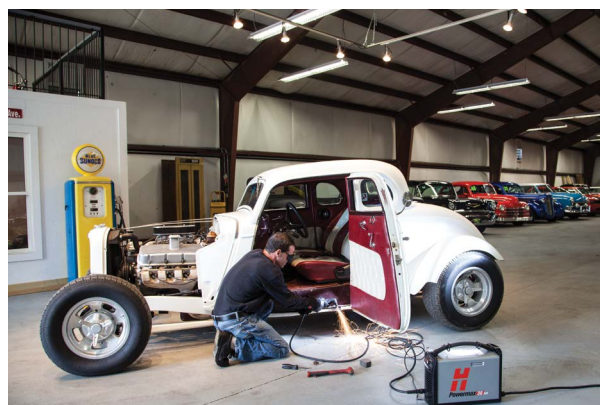
Réparation et modification de véhicules