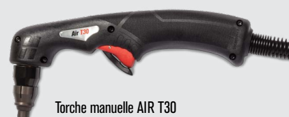
Torche manuelle AIR T30